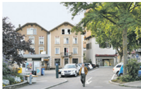
Die Häuserzeile vom ehemaligen Restaurant Geröll (l.) bis zur ehemaligen Papierzeile Rängg (r.) am Neuhäuser Industrieplatz wird einer Überbauung weichen.

Auch am Industriepark wird es laut Root & Partner AG mit Sitz in Neuhausen nicht renoviert werden. Bis auf weiteres